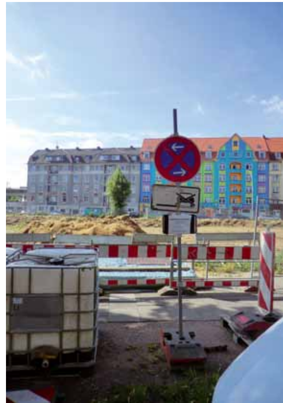
Viele Absichten, wenig Sichtbares: Blick auf das Gelände von der Oeverseestraße aus.

Das Stresemannquartier soll auf knapp 48.000 qm Bruttogeschoßfläche über 500 Wohnungen beherbergen, davon fast die Hälfte Studentenapartments. Geschäfte wie Drogerie- und Supermärkte, Flächen für gewerbliche Dienstleister und Gastronomie sowie 180 Parkplätze sollen in dem kompakten Bauvorhaben Platz finden.