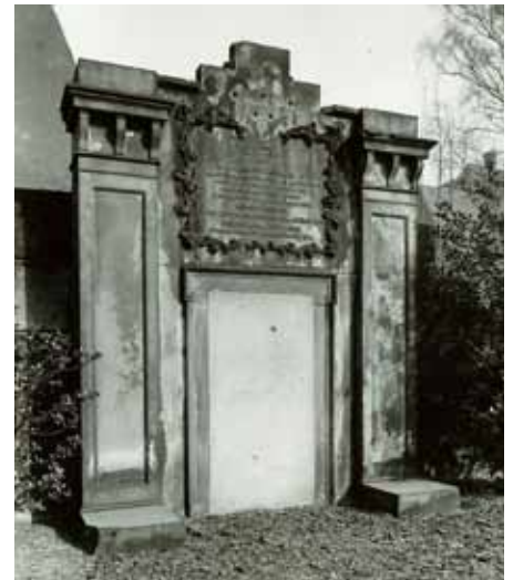
Zustand der Hügelgrabanlage Blücher kurz bevor sie 1959/60 mit einem Zuschuss des Denkmalschutzamtes erstmals restauriert werden konnte.

Vor fast 40 Jahren, im Jahr 1977, wurde der Friedhof entwidmet und bereits im Mai 1978 als Park wiedereröffnet. Der Verein Freunde der Denkmalpflege in Hamburg e.V. bezeichnet diesen Ort neben dem Lohbrügger Friedhof in einem vor zwei Jahren herausgegebenen Faltblatt über historische Hamburger Friedhöfe zu Recht als gelungenes Beispiel für die Umwidmung aufgelassener Friedhöfe in öffentliche Parks. Neugierig geworden? Wer tiefer in die ganz besondere Atmosphäre eintauchen, mehr über die Grabmale und die Geschichte des Wohlersparks erfahren möchte, kann dies mit mir gemeinsam am Donnerstag, den 24.09. bei einem ca 1½ stündigen historischen Spaziergang durch den Park. Treffpunkt: 18.00 Uhr vor dem Haupteingang an der Norderreihe / Teilnahmebeitrag 10 €.