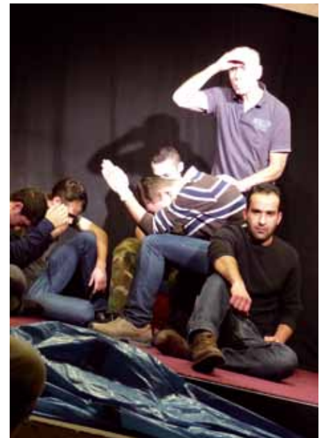
Theater Kaleidoskop: „Stopp, Checkpoint“. Flüchtlinge spielen Fluchtgeschichten. Vorstellung am 3.10., 20 Uhr im Bürgertreff

kinder werden in den benachbarten Kitas kleine Stücke aufführen, es gibt einen Impro-Workshop für Kinder, in Zusammenarbeit mit dem Kinderbuchhaus werden einige Schulklassen Szenen aus ihren Lieblingsbüchern vorspielen und eröffnet wird die Theaterwoche mit einem bunten Umzug durch den Stadtteil Theater ist bunt und vielfältig und zeigt die Stärken eines jeden Einzelnen. Der eine ist eher komisch, der andere eher ernst, der eine hat ein Handicap, der andere nicht – gemeinsam ist allen: Sie wollen rauf auf die Bretter, die die Welt bedeuten und das Publikum gut unterhalten. Und wir schauen ihnen gerne dabei zu!