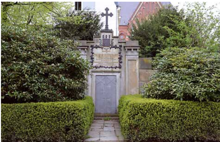
Zustand der Hügelgrabanlage Blücher im April 2015. Bereits 1973-1976 war eine zweite aufwendige Sanierung notwendig geworden. Heute präsentiert sie sich in einem sehr gepflegten Zustand.