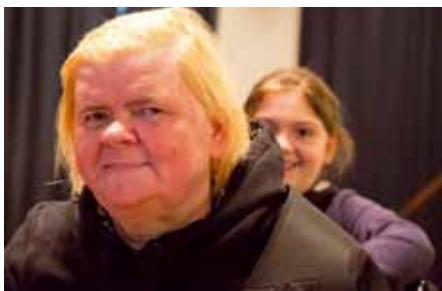
Immer ein Kind und ein alter Mensch bilden ein Team. Das klappt prima.

Geht das überhaupt? Theater spielen mit Menschen, die sich keine Texte merken können? Die oft nicht wissen, wo sie sind? Und wie ist das für die Kinder, wenn die Senioren sie beim nächsten Treffen nicht mehr erkennen? Kann man da überhaupt ein Stück entwickeln? Ja, man kann. „Kinder haben viel weniger Berührungängste im Umgang mit Demenz als Erwachsene“